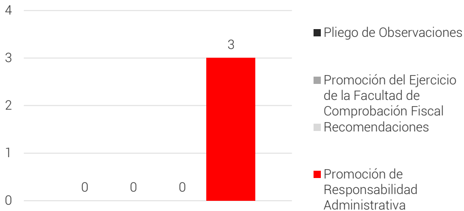
Resumen de las Acciones Derivadas de las Observaciones

Como resultado de los procedimientos de auditoría se emitieron observaciones por las cuales el ente auditado proporcionó documentación. En ese sentido, se presenta a continuación una síntesis de las justificaciones y aclaraciones presentadas por la entidad